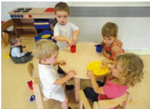
Car'hibou à Domsure : Jeu de dinette