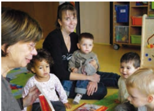
Caram'bole à Bénny : Autour du conte