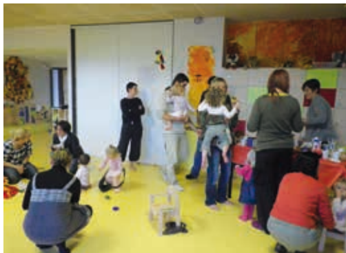
Goûter des familles pour la semaine du goût