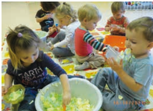
On s'amuse bien !